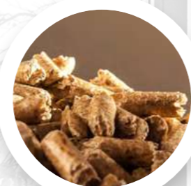
GRANULÉS DE BOIS